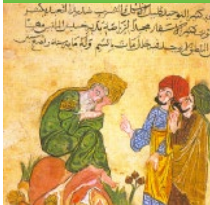
Manuscript bewaard in Topkapi Palace Library, Istanboel, Turkije